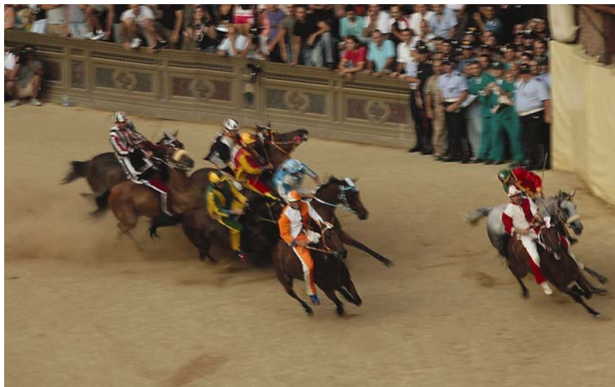
Niebezpieczny zakręt. Palio 2-go sierpnia 2007

Tegoroczny wyścig 2 lipca był najbardziej dramatyczny. Przez dwa z trzech okrążeń jeden z koni, zrzuciwszy jeźdźca, błąkał się bezpańsko na pokrytym tufowym piaskiem bruku. W pewnym momencie wierzchowiec zawrócił, a następnie pobiegł w poprzek toru. Prowadzący wyścig jeźdźcy w ostatniej chwili cudem niemal ominęli nieoczekiwaną przeszkodę.