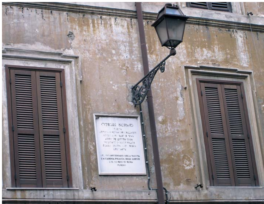
Tablica pamiątkowa na ścianie domu nr 123 przy via Sistina w Rzymie

Norwid żył się z Rzymem i jego ruinami, które były dla niego nie tylko źródłem inspiracji historiozoficznej, czy artystycznej, ale obcowanie z nimi było dla niego jakby rodzinnym