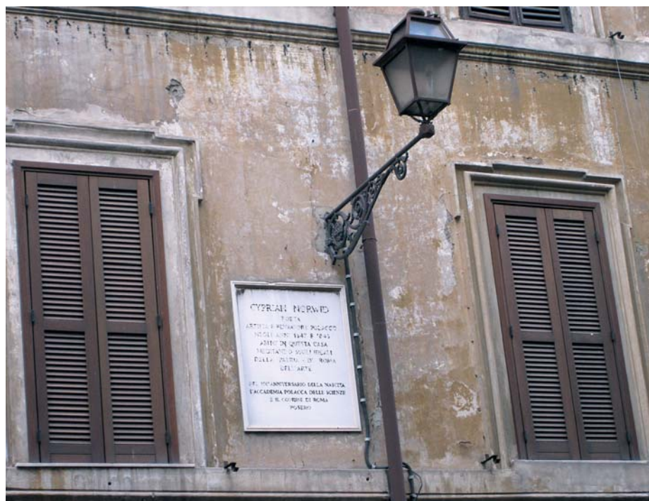
Tablica pamiątkowa na ścianie domu nr 123 przy via Sistina w Rzymie

W początkach 1849 roku opuścił Włochy. Przez wiele lat marzył o powrocie do nich, ale niestety marzenie to nie miało się już nigdy zrealizować.