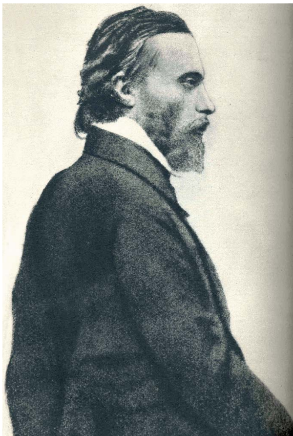
Cyprian Kamil Norwid

Wiele ze zwiedzanych miejsc utrwalił w swoich utworach. I tak np. słynna rzymska kawiarnia Caffè Greco , w której przesiadywał wraz ze swymi przyjaciółmi z polskiej bohemy oraz niezrównany opis scalinaty na Piazza di Spagna stały się tłem noweli Ad Leonnes . Opis Wenecji znalazł odbicie w Tajemnicy lorda Singelworth , pobyt przy grobie słynnych kochanek zaowocował wierszem W Weronie , zaś podróż na południe Włoch utworem Italiam, Italiam . Pomimo, iż w tym okresie nie napisał właściwie żadnego większego utworu, to wrażenia wyniesione z tych