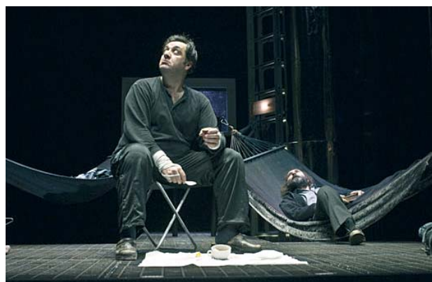
Emigranci Sławomira Mrożka w Parmie, 2009

Włoskie media zwracają uwagę na osobę reżysera, dobrze tu znanego, tak dzięki jego rolom teatralnym, jak i filmowym.