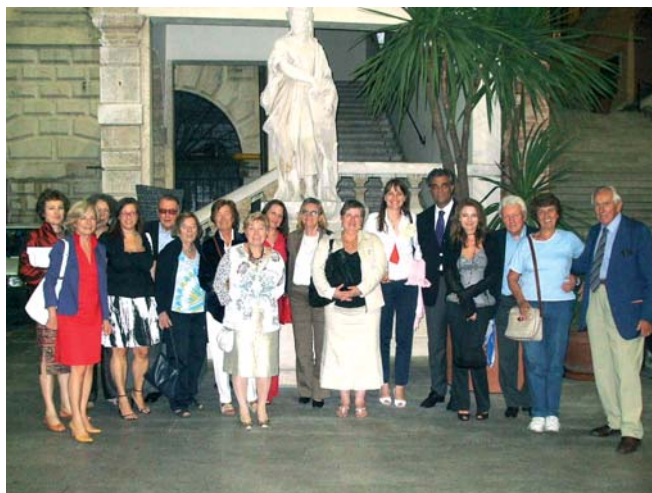
Uczestnicy Zarządu ZPwW podczas wieczornego zwiedzania Padwy