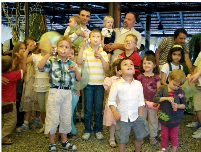
Dzieci w czasie Wiosennego Spotkania Polonii Mediolanu i Lombardii w Parku Ticino