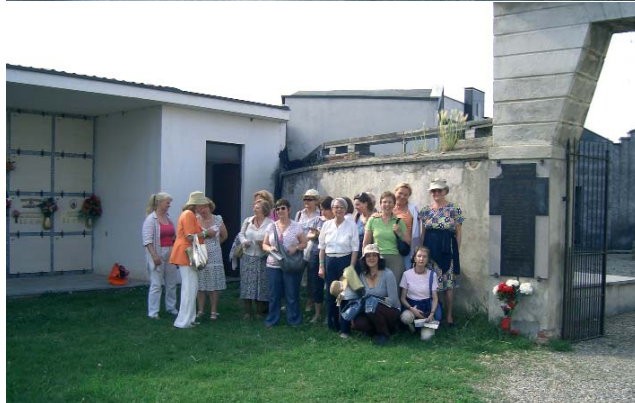
Uczestnicy wycieczki na tarasie pałacu la Venaria Reale; (poniżej) Członkowie Koła wraz z przedstawicielami Ogniska Polskiego przy tablicy w La Mandria di Chivasso

Warszawskiego (Wydział Archeologii Śródziemnomorskiej).