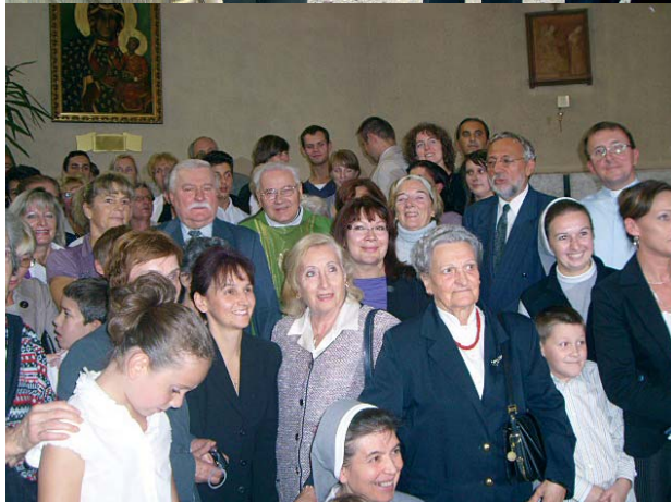
Lech Wałęsa w Turynie - (od góry) z przedstawicielami władz miejskich i (poniżej) z grupą polonijną po pożegnalnej mszy św.

parlamentu. Restauracja słynie z tego, że (w przerwach w pracach parlamentarnych) jadał w niej Camillo Benso conte di Cavour, (polityk, zwany też "architektem zjednoczenia Włoch" i jednym z czterech "ojców Ojczyzny"). Na legendarnym krześle Cavoura, miejscu honorowym, posadzono tego wieczoru Lecha Wałęsę.