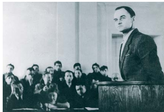
Marzec 1948. Rotmistrz Witold Pilecki przed sądem wojskowym. W zaaranżowanym procesie skazano go na śmierć

posłanek polskich, Ewy Tomaszewskiej i Hanny Foltyn-Kubickiej na forum Parlamentu Europejskiego odbyło się głosowanie o ustanowieniu dnia śmierci Witolda Pileckiego (25 maja) Międzynarodowym Dniem Bohaterów Walki z Totalitaryzmem. Wniosek został odrzucony głosami większości europarlamentarzystów, zarówno zagranicznych jak i polskich. ■