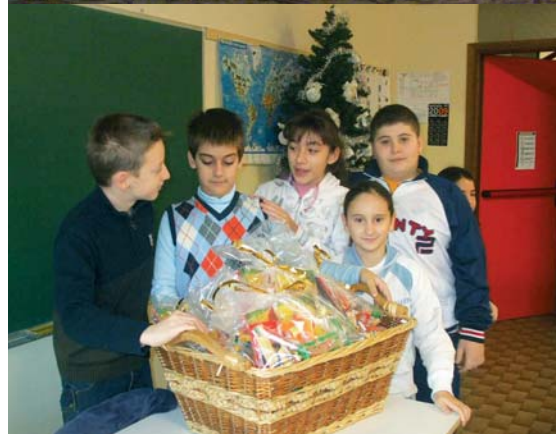
Powyżej: Zespół Schola z Olkusza w czasie jednego ze swych włoskich koncertów i św. Mikołaj w szkole w Pontenure