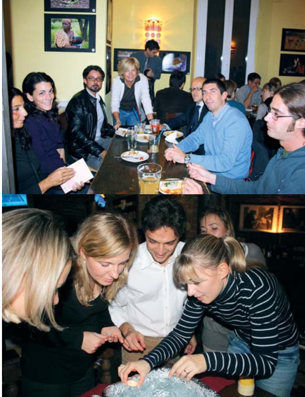
Spotkanie Młodej Polonii Związku Polaków w Mediolanie. Na zdjęciu dolnym: lanie wosku