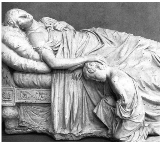
Nagrobek matki poety w kościele w Opinogórze, majątku Krasińskich, dzieło L. Pampalonięgo. Jego kopia znajduje się w Gipsotece Bartoliniego we Florencji – kłęczące dziecko to mały Z. Krasiński

Jesienią 1838 r. Krasiński udał się w towarzystwie ojca w kolejną podróż do Włoch , gdzie mieli wspólnie spędzić zimę. Nie przypuszczał wówczas generał Krasiński, że na szlaku tej podróży los gotował już nową przygodę, w którą sam nieświadomie wplątywał swego syna. W Neapolu, w rok po zerwaniu z Joanną Bobrową, Krasiński nawiązał romans z Delfiną Potocką, największą miłością jego