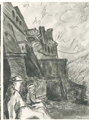
Zygmunt Turkiewicz, rysunki przedstawiające Monte Cassino po bitwie, 1944