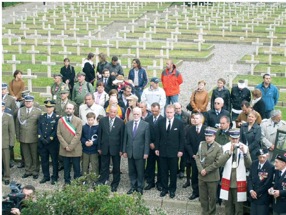
Uroczystości 65. rocznicy wyzwolenia Bolonii na Polskim Cmentarzu Wojskowym San Lazzaro