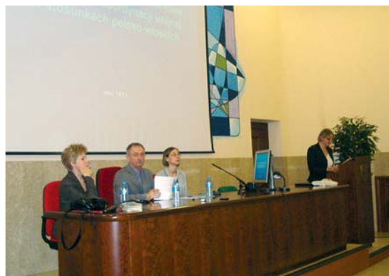
Dni poradnictwa dla Polaków w Rzymie

Planowane są kolejne spotkania tego typu. Informacje o nich będzie można znaleźć na stronie internetowej Wydziału Konsularnego w Rzymie.