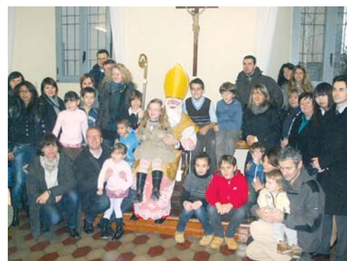
Oplatkowe spotkanie polonijne w Piacenzy Powyżej: Koncert zespołu Tibi Dabo