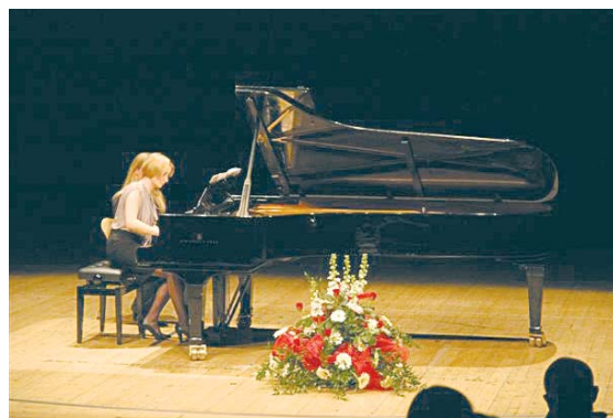
Koncert Gaji Kunce Powyżej: Dzieci na balu karnawałowego

Felice, przy którym znajduje się nasza siedziba, kostiumowy bal karnawałowy dla swych najmłodszych członków. Prawie 50 dzieci, w wieku od roku do 11 lat, przebranych w najrozmaitsze stroje, od Królowy Śnieżki, poprzez Batmana, Czerwonego Kapturka oraz różne zwierzęta, bawiło się pod kierunkiem wodzireja. Grom i zabawom towarzyszył poczęstunek przygotowany przez mamy. Nie zabrakło niespodzianek i prezentów. Zabawa skończyła się późnym wieczorem, dzieci wróciły za-