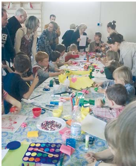
Tradycyjne spotkanie wielkanocne "Jajko"

27 marca , w cyklu uroczystości poświęconych rocznicy 150-lecia Zjednoczenia Włoch, na placu przy Torino Esposizioni odbyło się folklorystyczne spotkanie. Circoscrizione 2 Turynu poprosiła przedstawicieli Ogniska Polskiego, aby byli przybyli na nie z polską narodową flagą, którą uroczyste