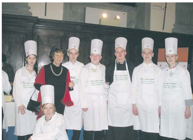
Młodzi kucharze w czasie spotkania Saperi e saporì in Cattedra

w 9 florenckich restauracjach, zapoznając się z kuchnią włoską, a w szczególności toskańską. Zwiedzili laboratoria szkoły w Prato, Mercato Centrale we Florencji, przygotowali specjalności gastronomiczne swego kraju, korzystając z kuchni florenckiej firmy cateringowej. Na bankiecie w Palazzo da Parte Guelfa podano je 150 zgromadzonym gościom. "Polskim akcentem" tego przyjęcia było wino Chianti, pochodzące z Fattoria di Sammontana w Montelupo Fiorentino,