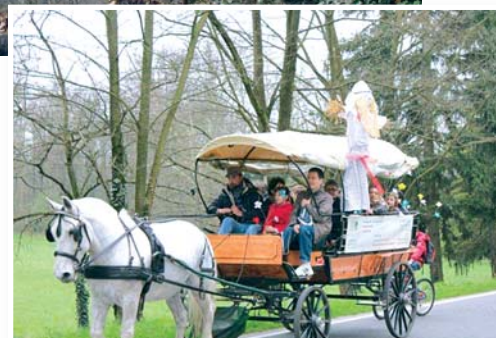
Wiosenne topienie Marzanny Powyżej: Andrzejki 2010 w Mediolanie Obok: Uczestnicy prze- glądu filmów Wajdy Cinema Wajda 2010