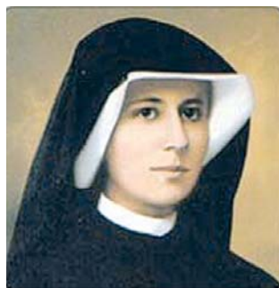
Polscy święci: królowa Jadwiga, Albert Chmielowski, Maksymilian M. Kolbe, Urszula Ledóchowska i Faustyna Kowalska

chodziła wątpliwość czy istotnie przysługują mu formy kultu publicznego, zarezerwowane w Kościele katolickim dla świętych kanonizowanych. Ojciec św. z wielką życzliwością podjął przedstawioną prośbę, skierowując całą kwestię do zbadania przez specjalny urząd, jakim jest Kongregacja Spraw Kanonizacyjnych. W oparciu o jej ustalenia, w katedrze ryskiej w czasie wizyty apostolskiej, dnia 8 września 1983